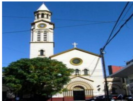
San Ramón Nonato