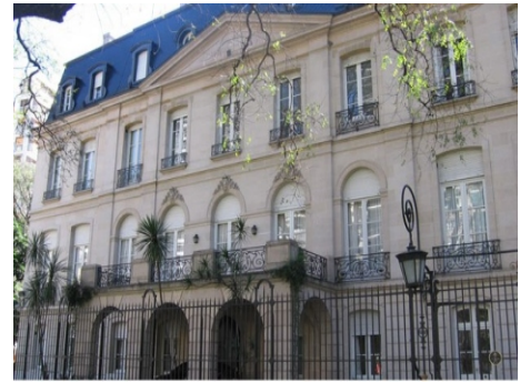
Embajada de Arabia Saudi