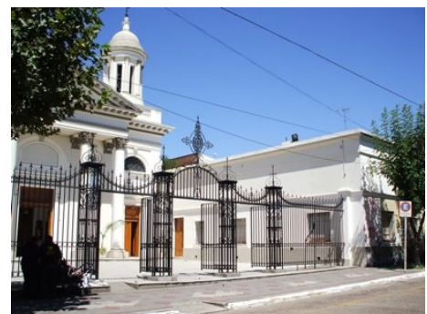
Obispado de Lomas de Zamora