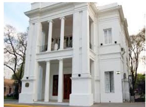
Casa Municipal de Adrogué